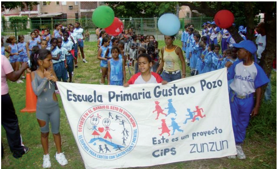
SchülerInnen der «Gustavo Pozo»-Schule in Reih und Glied – zu Ehren unserer GönnerInnen.

Zusammen mit der Asociación de Pedagogos de Cuba organisierte Zunzún zwei nationale Seminare für jugendliche Leader aus allen Provinzen des Landes. Diese Jugendlichen engagieren sich in ihren Gemeinden in Projekten, die wichtige soziale Kompetenzen wie Respekt, Konflikt- und Teamfähigkeit oder die Eigenverantwortung von Kindern und Jugendlichen fördern. An den 4-tägigen Seminaren nahmen über 100 junge LeiterInnen verschiedener erfolgreicher Kinder- und Jugendprojekte teil. Ziel der Seminare war es, einerseits die Bildung von Netzwerken sowie Synergien zu fördern, andererseits gewonnene Erkenntnisse und positive Erfahrungen aus der Kinder- und Jugendarbeit einer breiteren Öffentlichkeit zugänglich zu machen. Gleichzeitig fanden durch professionelle Pädagogen begleitete Workshops statt, in denen Probleme und Herausforderungen diskutiert und Empfehlungen für eine Verbesserung der partizipativen Jugendförderung ausgearbeitet wurden. Die gewonnenen Erkenntnisse werden in einem Handbuch zusammengestellt und mit der Unterstützung von Zunzún publiziert.