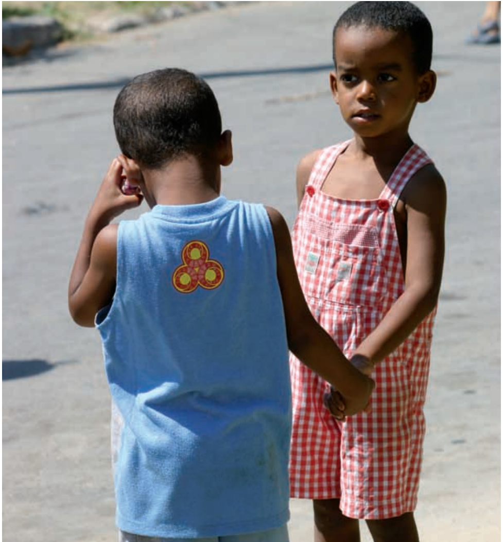
Zwei kleine Kubaner warten auf weitere Inputs ihrer Betreuer.

Haben Sie darüber hinaus FreundInnen, Verwandte und Bekannte, die sich für Kuba interessieren? Gerne stellen wir diesen Zuzún persönlich vor oder senden ihnen den aktuellsten Newsletter. Weitere Informationen finden sich auch auf www.zuzun.ch .