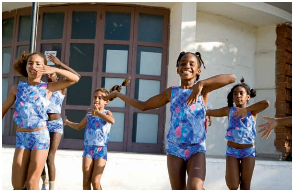
Schülerinnen der «Gustavo Pozo» scheint der Gymnastikunterricht Spass zu machen.