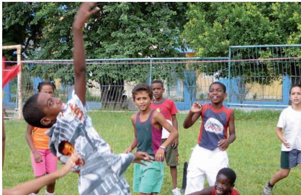
SchülerInnen der Primarschule «Gustavo Pozo» beim Volleyballspiel.