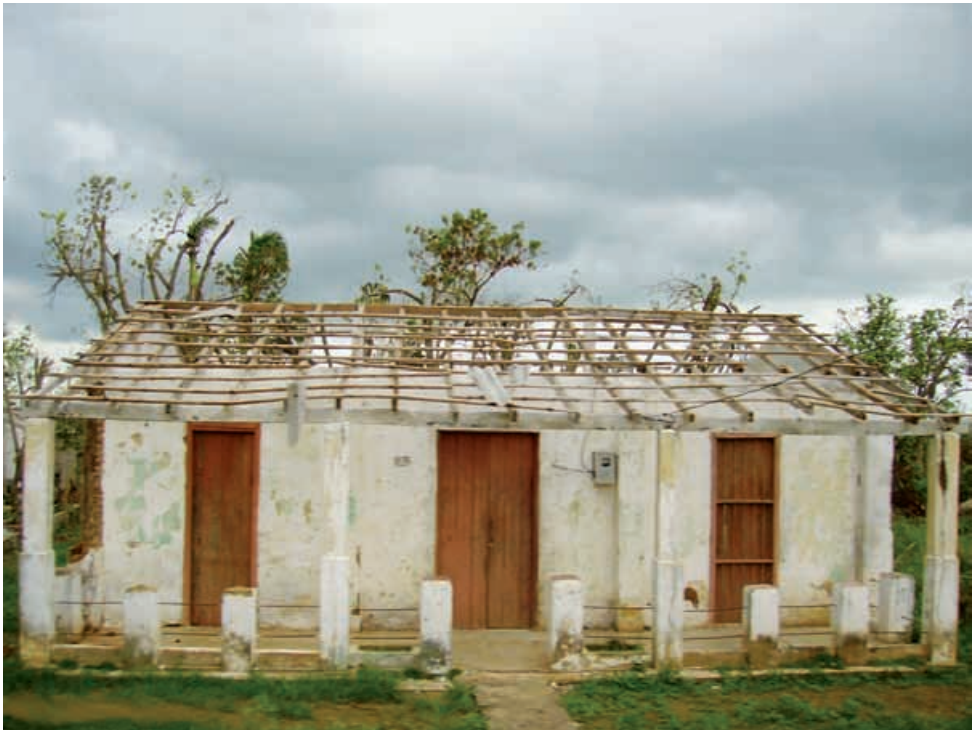
Durch Wirbelsturm Ike zerstörtes Haus in der Region Pinar del Rio.